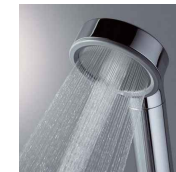
W水流シャワー (メタル)