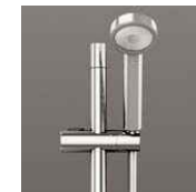
握りバー兼用スライドバー Bタイプ (メタル)